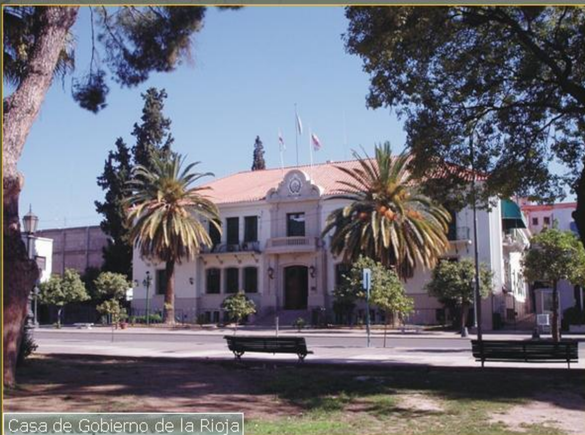
Casa de Gobierno de la Rioja

Dirección General de Estadística y Sistemas de Información