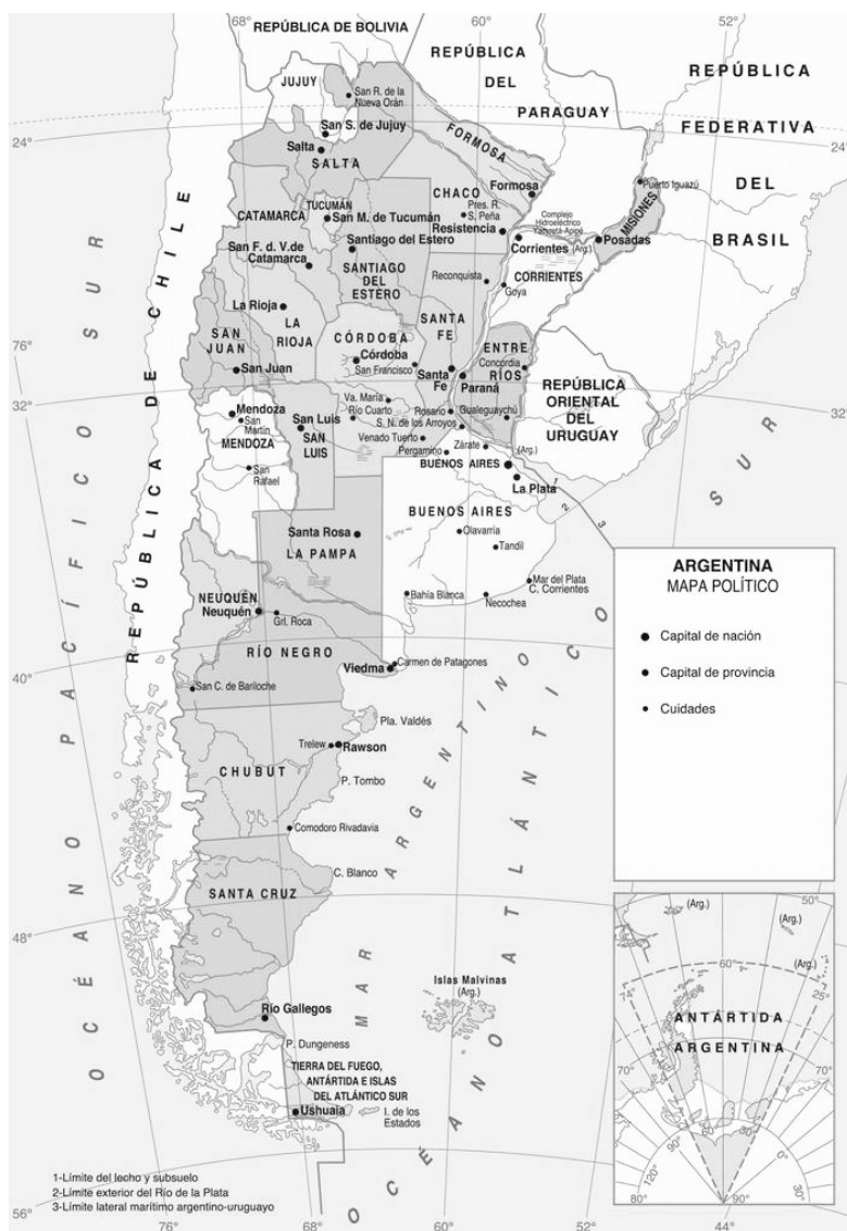
Mapa 1 - República Argentina según división territorial.

La composición por lugar de nacimiento de los migrantes internos (Cuadro 2) muestra históricamente la preponderancia de los migrantes nacidos en las provincias de Buenos Aires, Santa Fe, Entre Ríos y Córdoba, que son las provincias que se encuentran bordeando la ciudad. No obstante su peso relativo se redujo de cerca del 80 por ciento a fines del siglo XIX al 67 por ciento para el último censo de población. Un grupo de provincias más lejanas, pero que adquirieron importancia desde los setenta está integrado por: Tucumán, Corrientes y Santiago del Estero. El mismo concentró entre 16 y 18 por ciento de los migrantes internos, especialmente en las décadas de los setenta y ochenta, pero descendió al 11 por ciento en 2010.