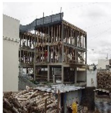
Montes Carballo 1674