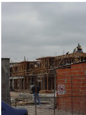
Sector Bonorino Ob 6 – Mz 3J