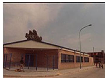
Centro de Salud