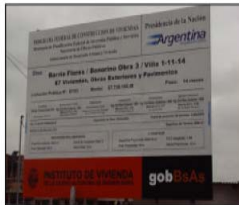
Villa 1-11-14 Obra: Sector Bonorino – Obra 3 – Manzana 3J Viviendas: 87 Empresa constructora: VIDOGRAR S.A.