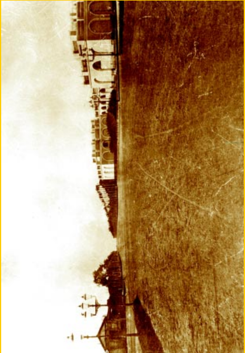
Avenida de las Palmeras (hoy avenida Sarmiento).