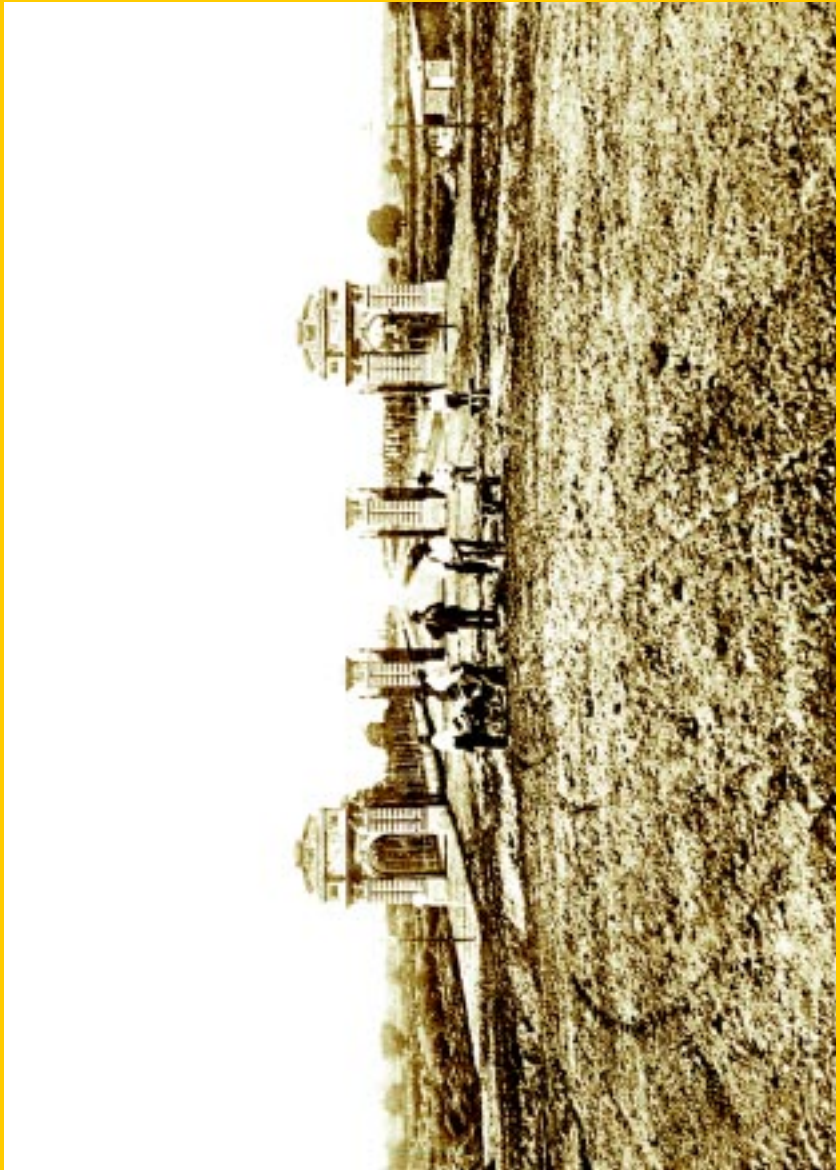
Portones de Palermo (cabecera de la actual avenida Sarmiento). Lámina N° 35 Fotografía Witcomb, en Casa Witcomb, Buenos Aires antiguo , Buenos Aires, Peuser, 1925.