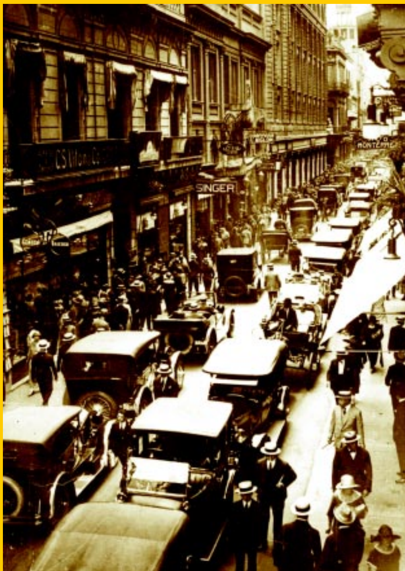
Calle Florida, 1923.