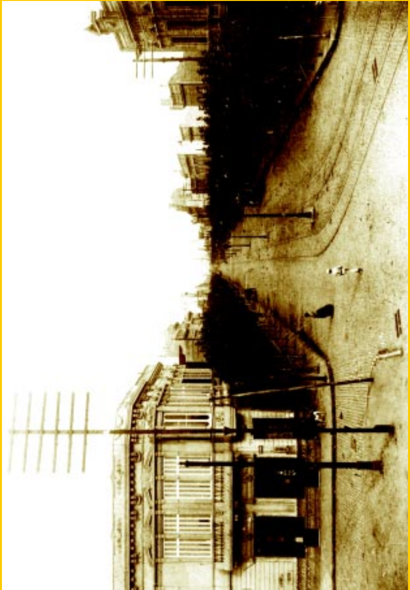
Alegría (hoy Wenceslao Villafañe) y Almirante Brown en 1903. (Foto Archivo General de la Nación).