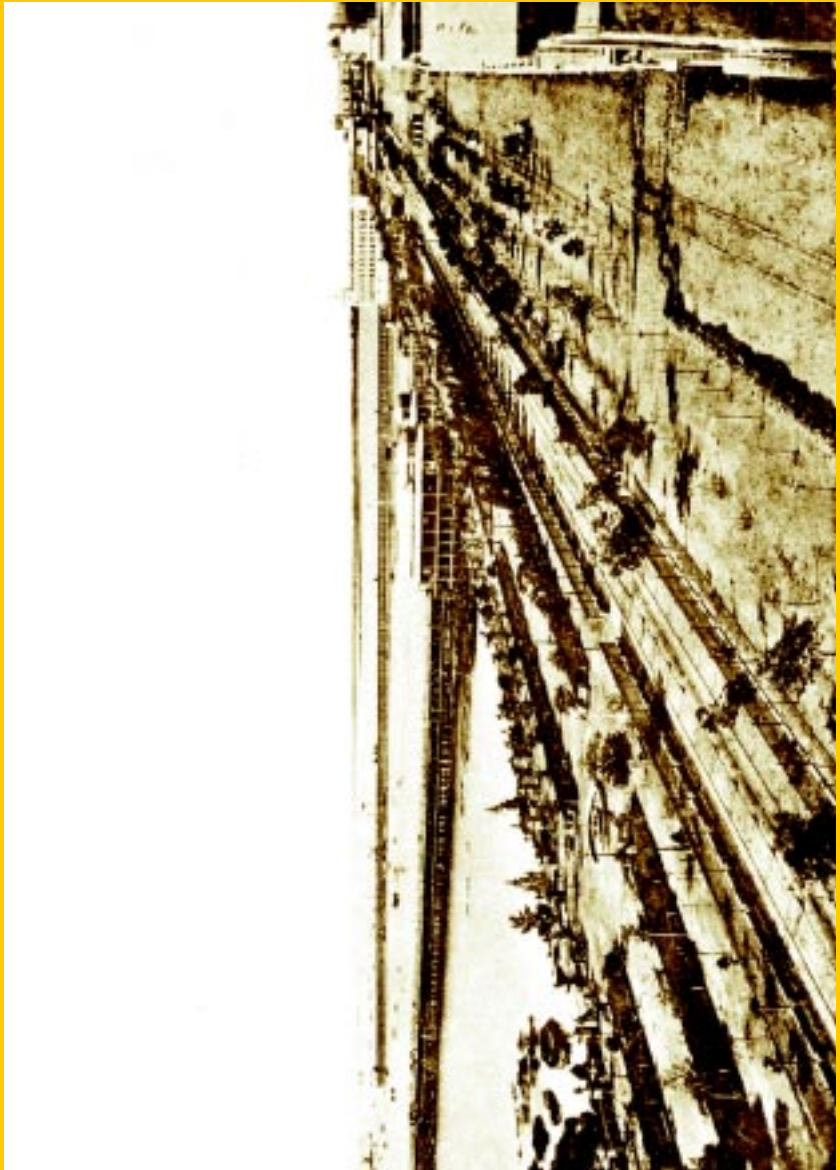
Paseo de Julio y muelles de pasajeros y de la Aduana. Lámina N° 43