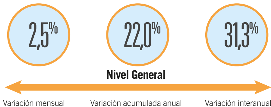
Cuadro 1 IPCBA según divisiones de la canasta. Índice y variación porcentual respecto del mes anterior, acumulado anual e interanual