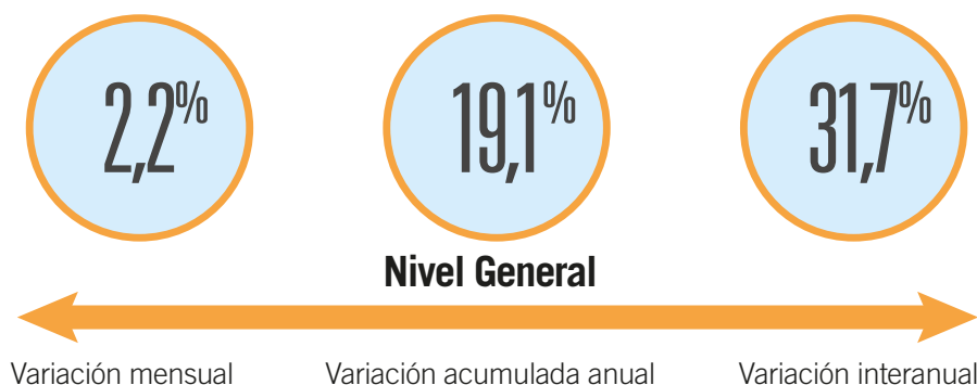
Cuadro 1 IPCBA según divisiones de la canasta. Índice y variación porcentual respecto del mes anterior, acumulado anual e interanual