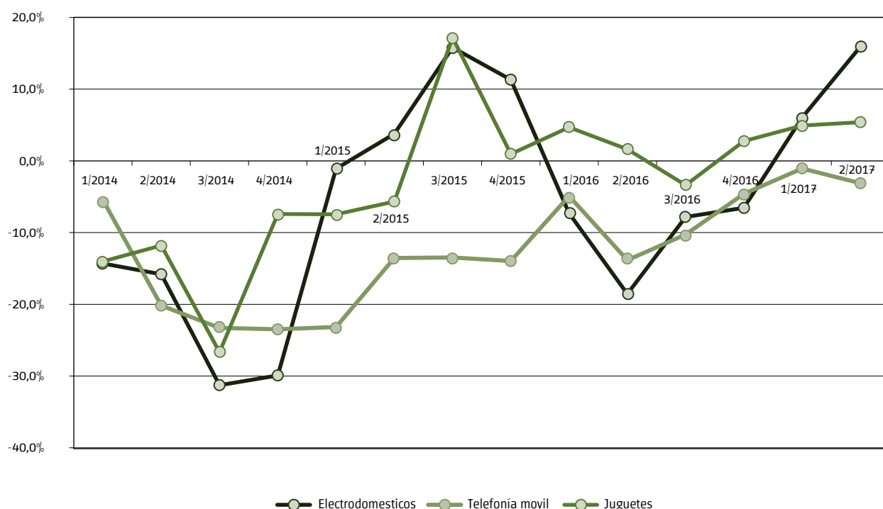
Gráfico 3 Evolución de la variación porcentual interanual por trimestre de ventas de electrodomésticos, telefonía móvil y jugueterías. Ciudad de Buenos Aires. 2do. trimestre de 2017