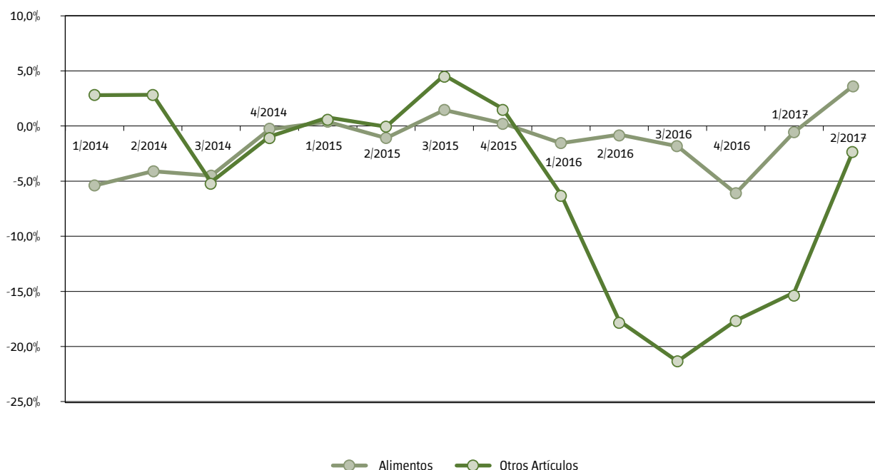
Gráfico 1 Evolución de la variación porcentual interanual por trimestre de ventas en supermercados. Ciudad de Buenos Aires. 2do. trimestre de 2017